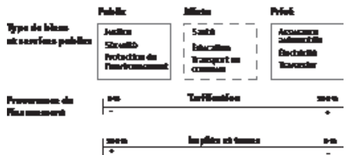
SCHÉMA 1 Diversité des modes de financement selon le type de biens et services publics